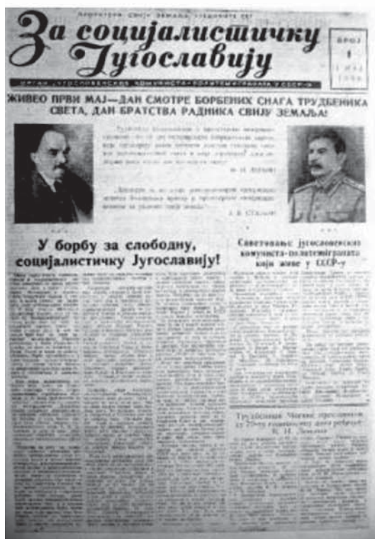
6. „Pentru Iugoslavia socialistă”, organul de presă al staliniștilor iugoslavi de la Moscova .... (9/1949, p. 7);