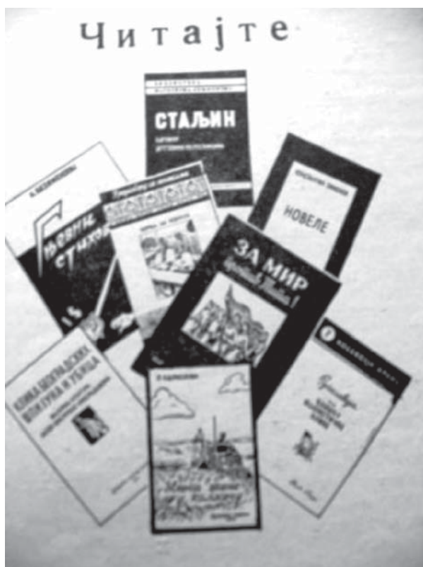
12. Panoplie a „capodoperelor” limbii „de lemn” pentru sârbii din România