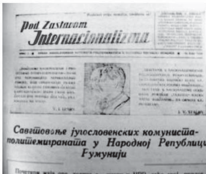
7. „Sub flamura internaționalismului”, publicația staliniștilor iugoslavi de la București ... (9/1949, p. 63)