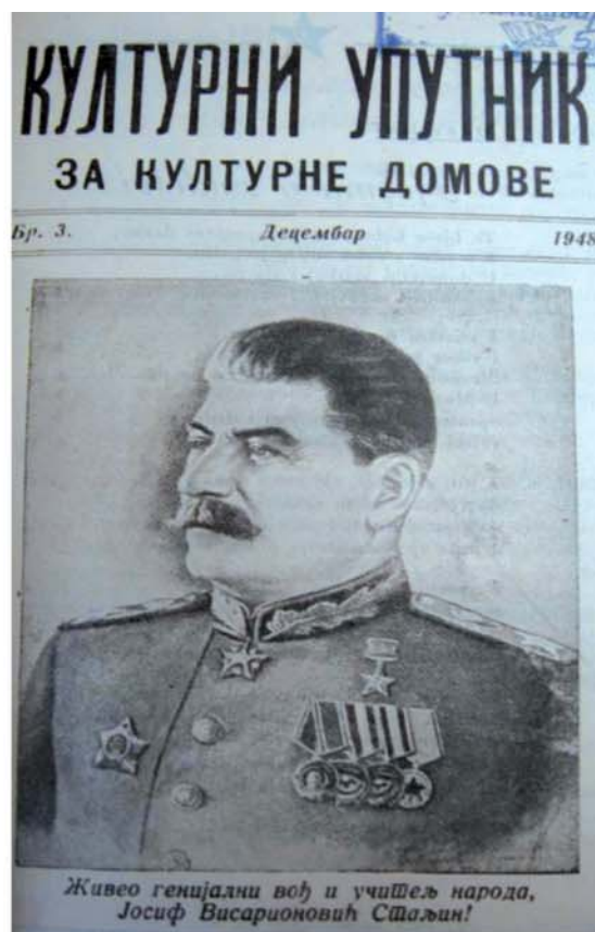
2. Chipul nelipsit al „genialului conducător și dascăl al popoarelor”, din cuprinsul „Îndrumătorului cultural” (nr. 3 / 1949, p. 19)