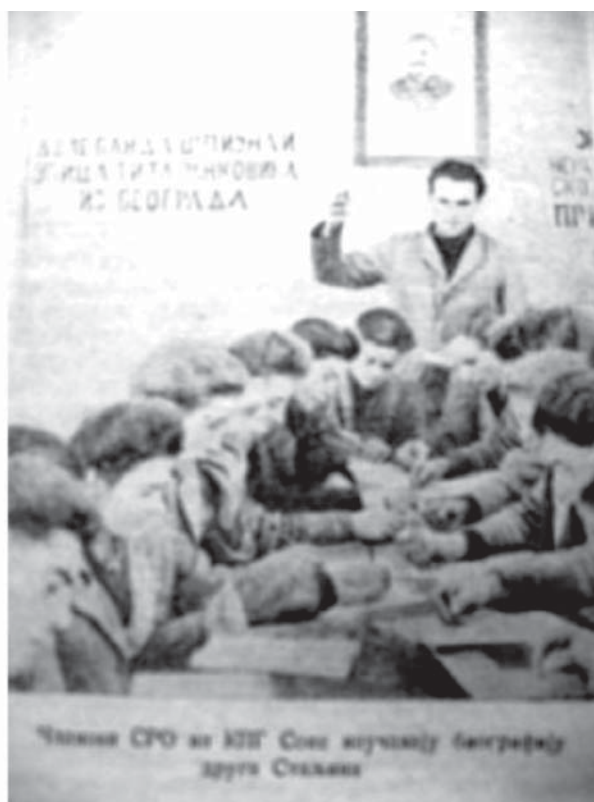
13. Cercul de studiere a biografiei tovarăşului Stalin la Colectiva „Arso Jovanovici” din Soca