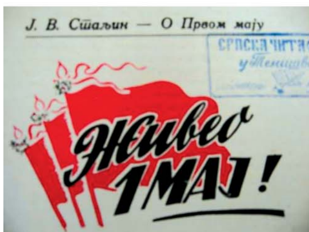
3. Și despre 1 Mai tot Stalin avea cuvântul decisiv (nr. 8 / 1949, p. 1)