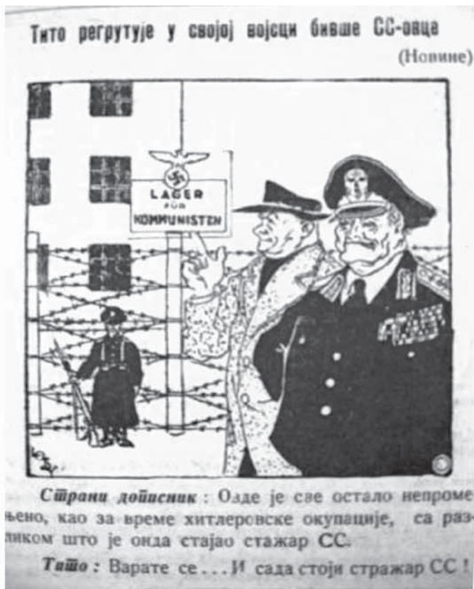
5. Tito recrutează foști SS-iști... ( 9 / 1949, p. 63)