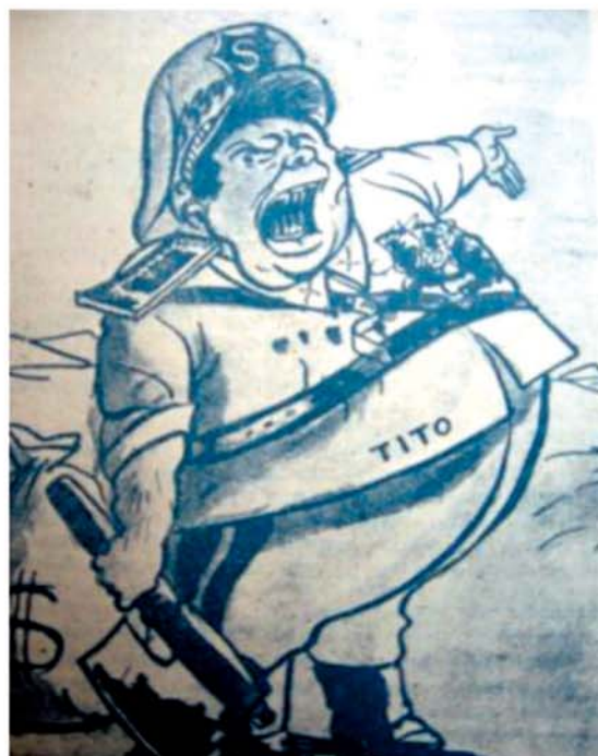
4. Tito cu barda. Cea mai „populară” caricatură din acei ani a conducătorului iugoslav ... (5 / 1950, p. 19)