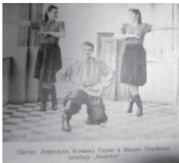
11. La Căminul cultural din Variaş se repetă „kazacioc”; în timp ce „titoiştii”, „chiaburii” şi ceilalţi „duşmani ai poporului” iau drumul Bărăganului